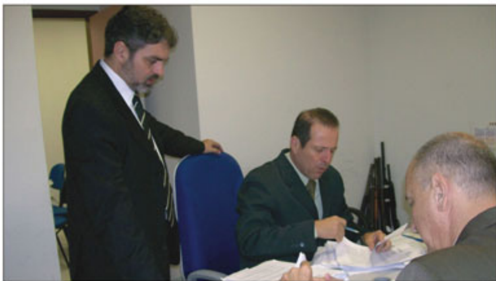
Equipamentos eletrônicos de segurança e ampliação do quadro de pessoal são algumas das solicitações dos juízes

O juízo não tem máquina de protocolo e o cartório do órgão é o único do Fórum estadual responsável pelo cadastro e distribuição dos processos, inquéri-