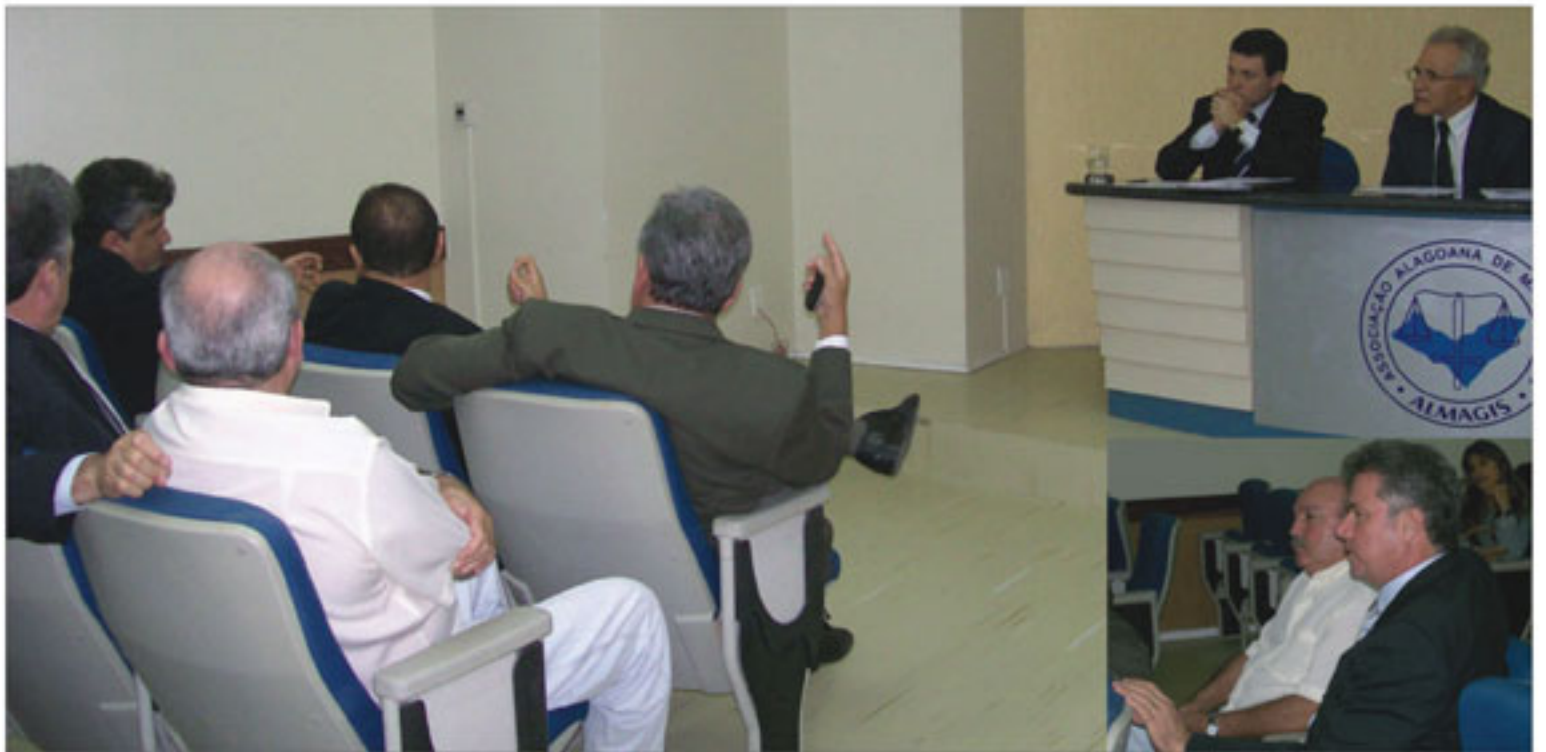
Integrantes do colegiado decidiram ir a Brasília para impedir aprovação da PEC; deputados federais Joaquim Beltrão e Carlos Alberto Canuto apóiam iniciativa